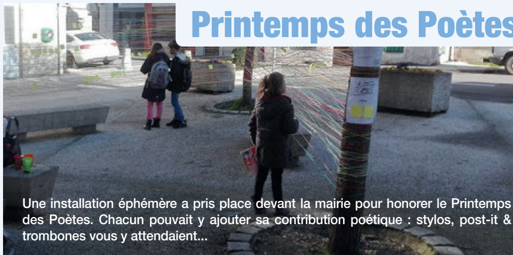
Une installation éphémère a pris place devant la mairie pour honorer le Printemps des Poètes. Chacun pouvait y ajouter sa contribution poétique : stylos, post-it & trombones vous y attendaient...