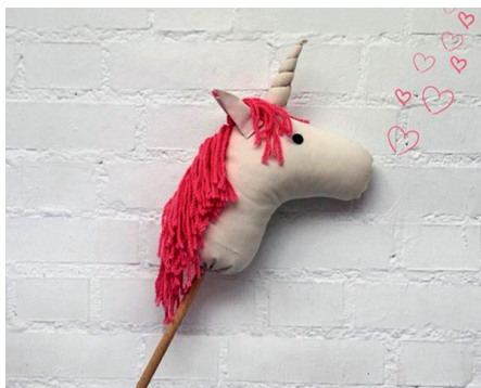
mardi 23 avril Chevauchons la licorne ! atelier adultes-enfants de 15h à 17h

En tandem adulte-enfant, nous réaliserons des accessoires qui seront prêtés aux plus jeunes pendant le Festival des Imaginaires (Ils seront rendus à leurs créateurs ultérieurement... dans la mesure du possible). Au programme: mardi 23 avril, création de licornes galopantes, et jeudi 15 avril, création de turbo-réacteurs. D'ici là, la bibliothèque est intéressée par la récupération de grandes bouteilles plastique, de laines multicolores (même en petites quantités) et de grands bâtons. Ces ateliers sont gratuits et ouverts à tous. Les enfants de moins de 6 ans devront être accompagnés.