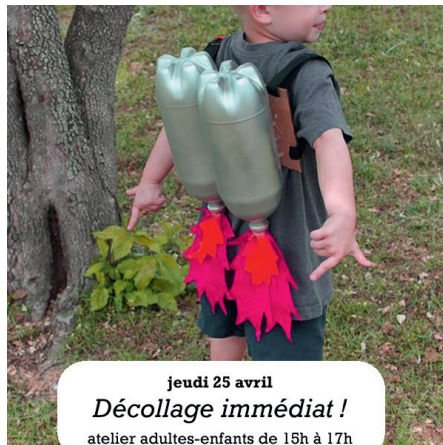
jeudi 25 avril Décollage immédiat ! atelier adultes-enfants de 15h à 17h

Préparons ensemble le Festival des Imaginaires ... à la bibliothèque de Ravières